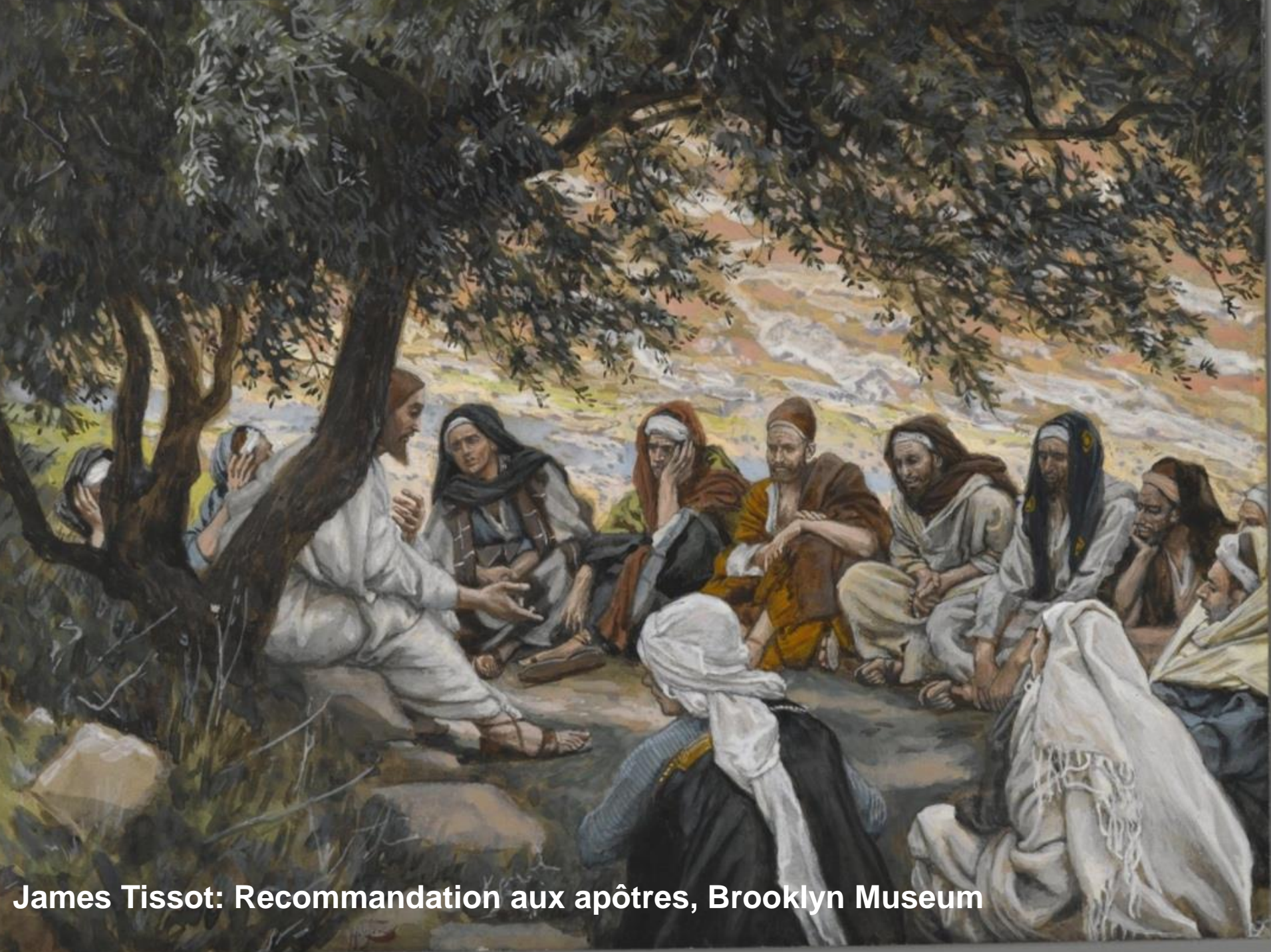
James Tissot: Recommandation aux apôtres, Brooklyn Museum