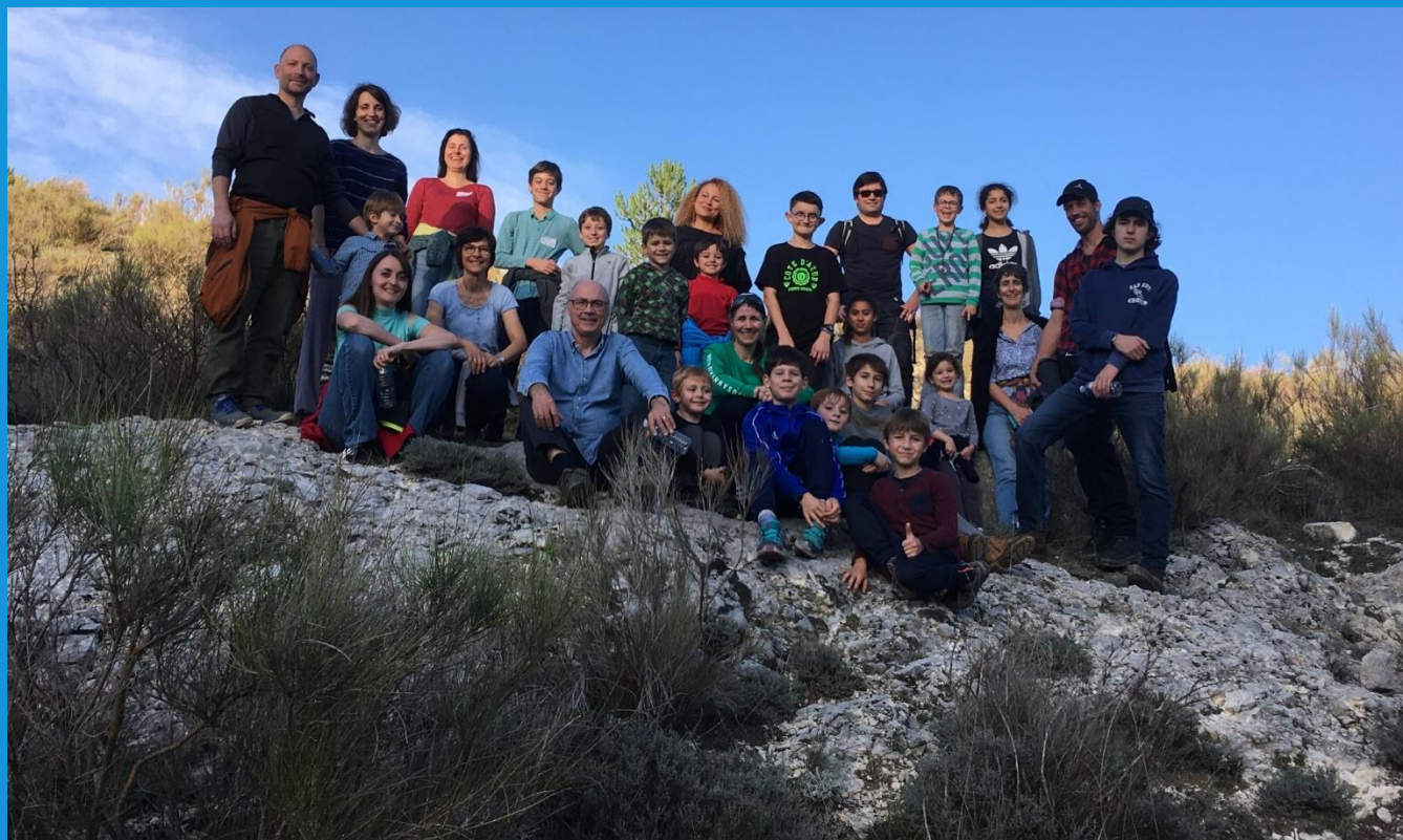
Camp famille messianique en automne 2019